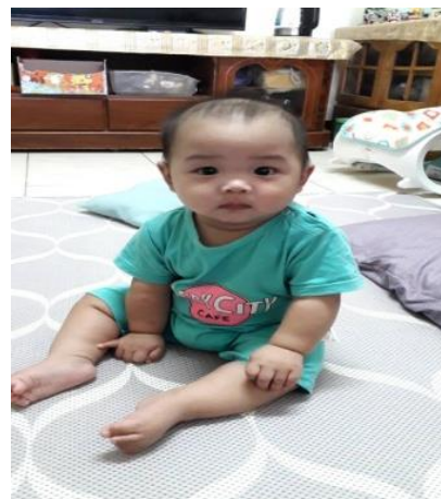
原管課 古安的 baby